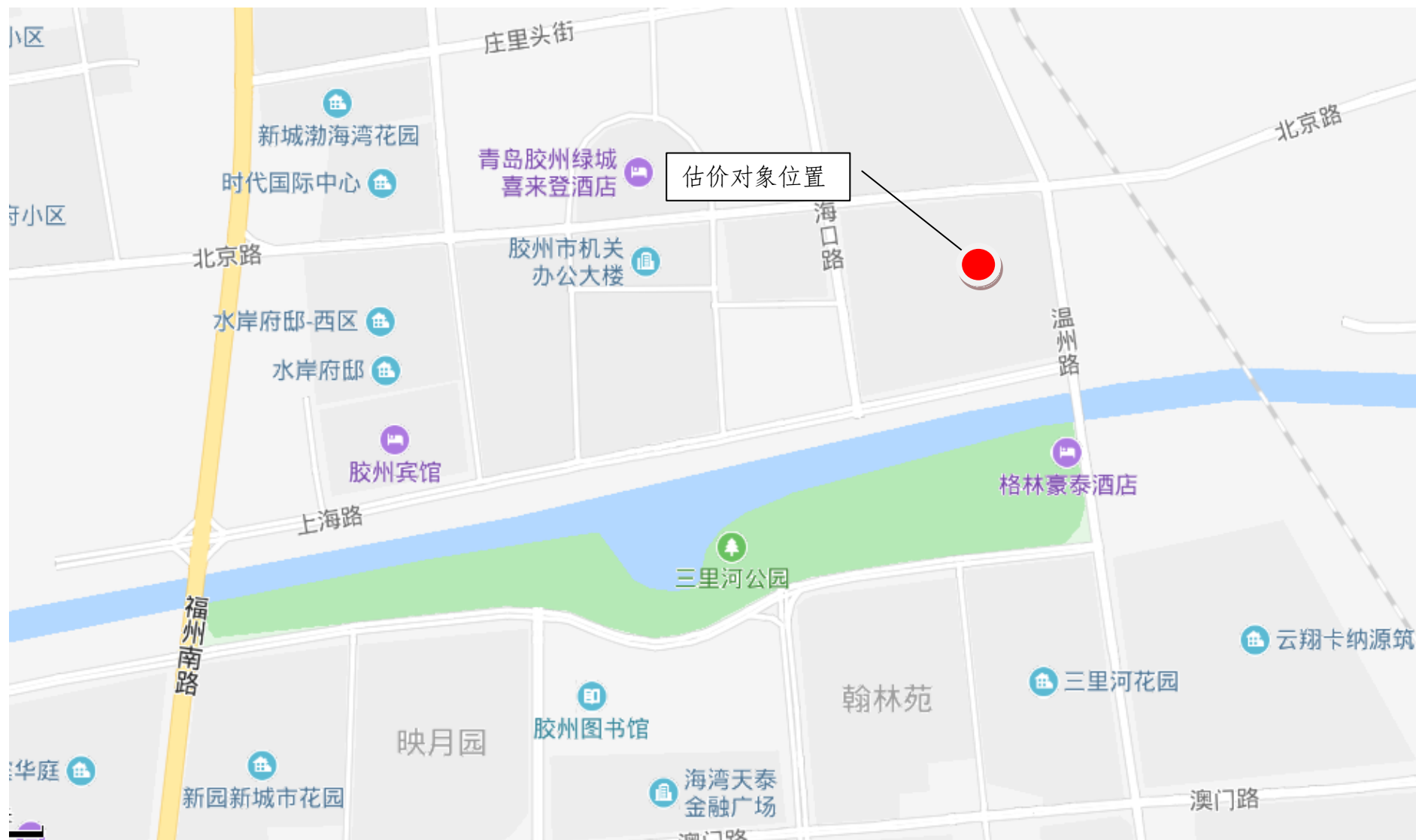
估价对象区域位置