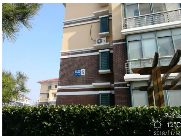
估价对象所在楼座