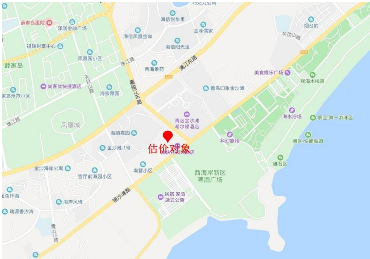
估价对象区位状况图