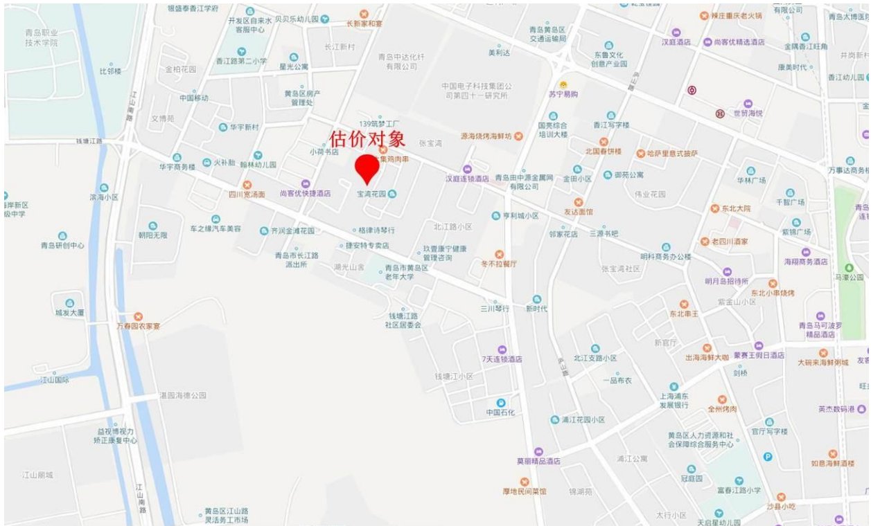
估价对象区位状况图