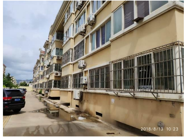
估价对象所在楼座外立面