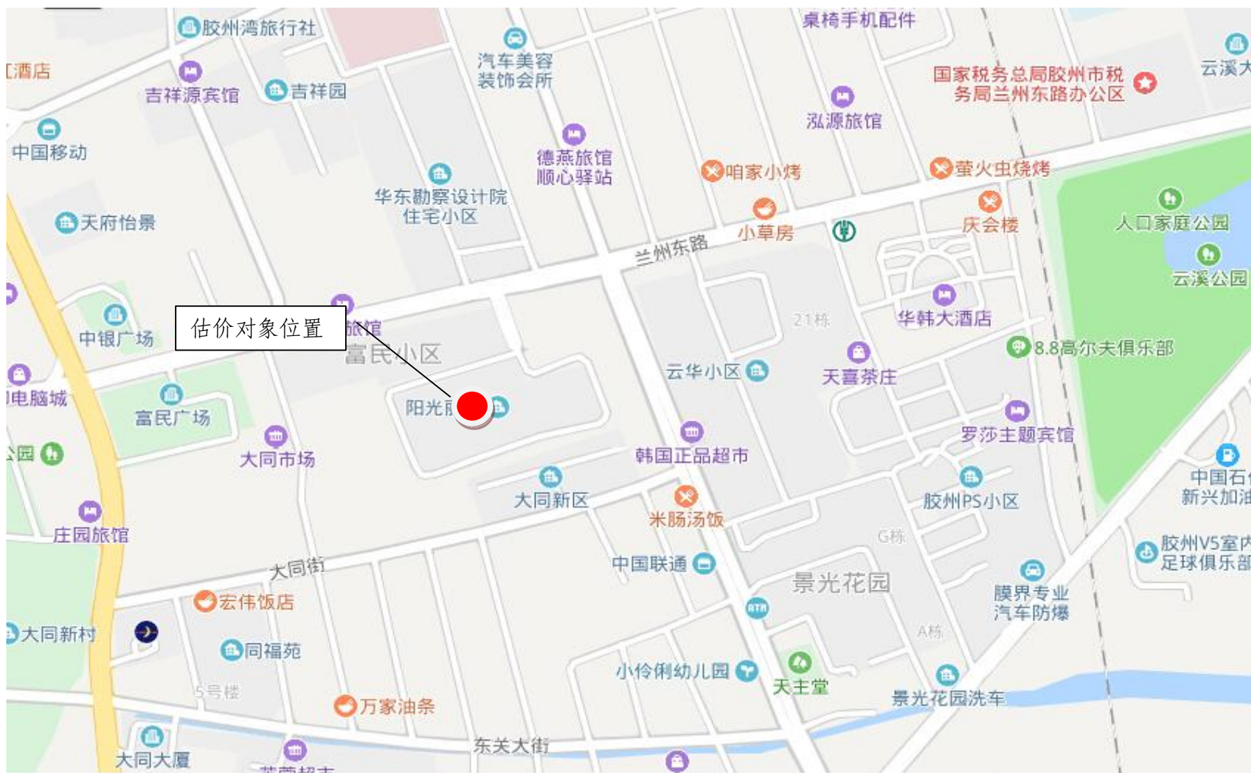
估价对象区域位置