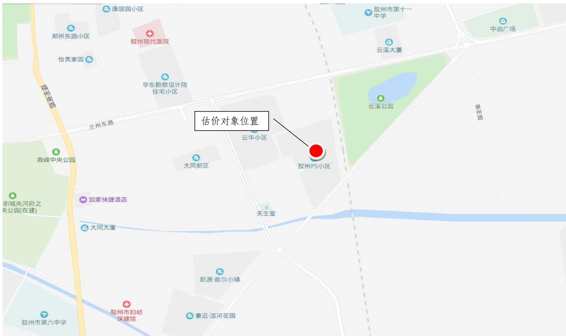
估价对象区域位置图